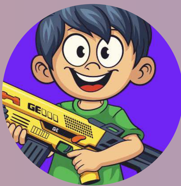
Gelvor Air Guns