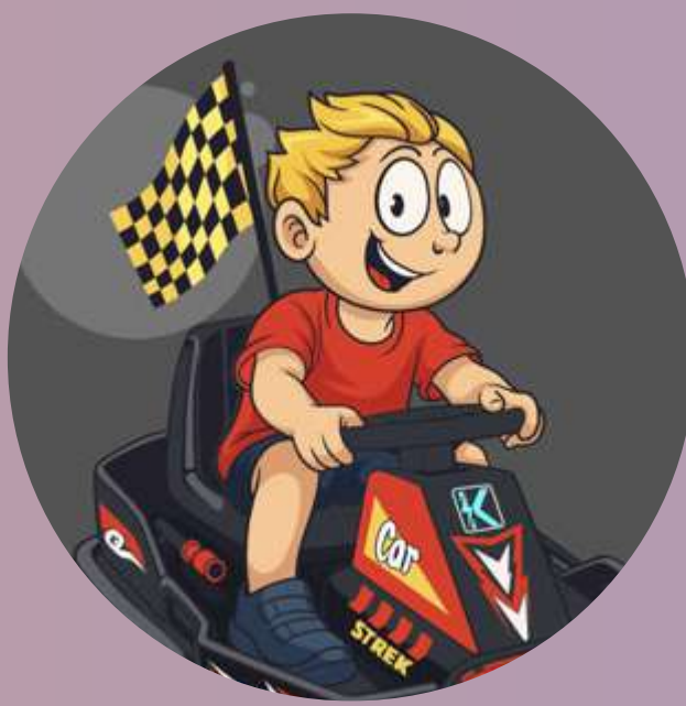
Apprendre à conduire