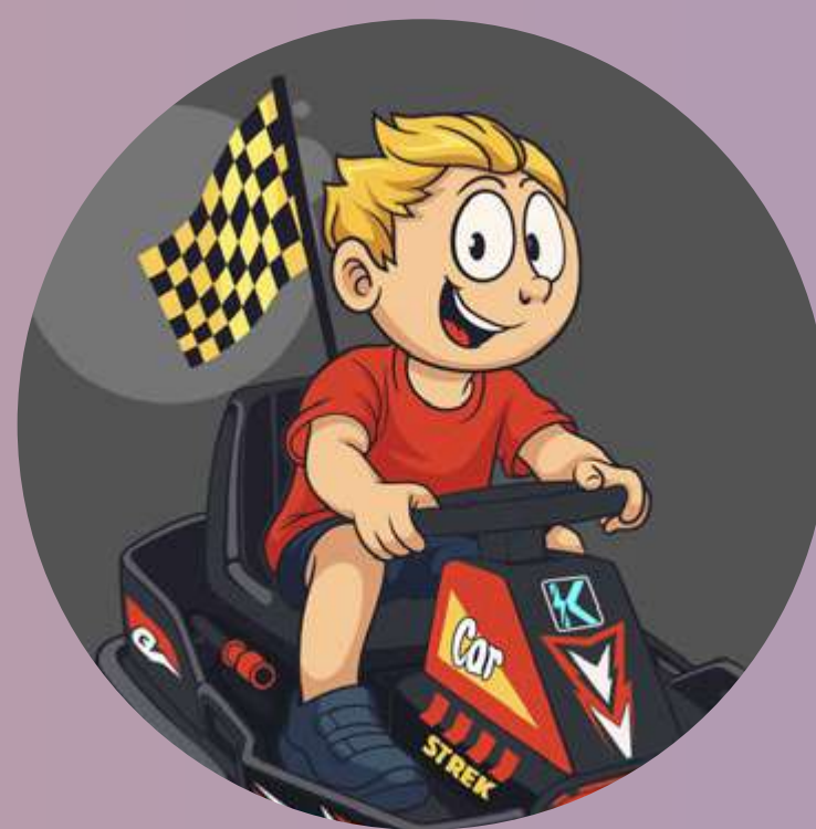
Apprendre à conduire