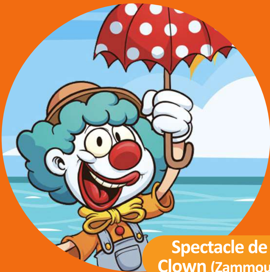
Spectacle de Clown (Zammour)

Les spectacles donnés sont conçus par des professionnels pour amuser les enfants et leur enrichir la culture ! Veuillez consulter ci-dessous les spectacles prévus.