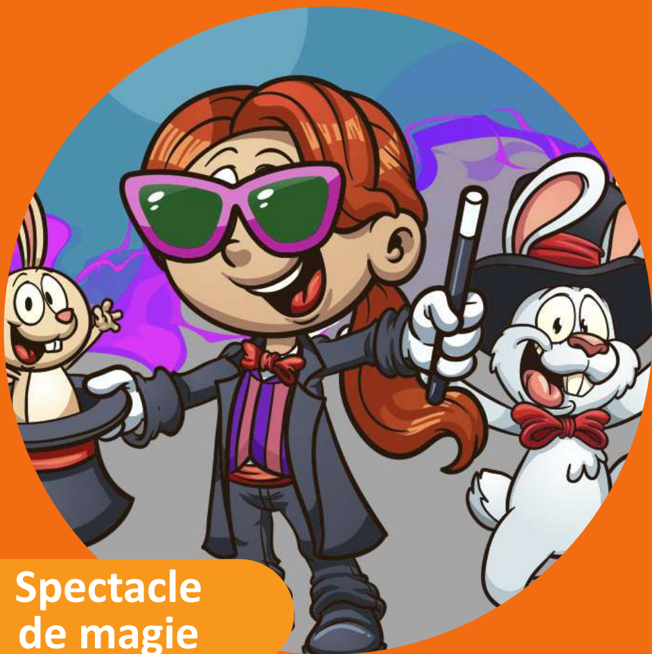
Spectacle de magie